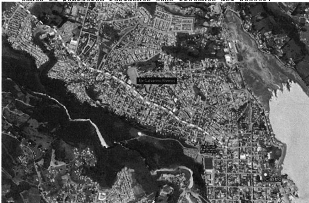
FIGURA 4: Esquema reconocimiento eje Galvarino Riveros

. Mejoras en la red vial, con potencial uso de vías de evacuación frente a incendios: Se reconoce al eje vial Galvarino Riveros como estructurante dentro de la trama vial de la comuna, conectando de manera longitudinal el centro, con los sectores pericentrales de la urbanización existente. Frente a esta condición, es que se sugiere considerar dicho eje como una potencial vía de evacuación frente a posibles futuros eventos incendiarios. Para ellos, deben disponerse recursos o estrategias de mejora que aseguren el estándar material mínimo para estos efectos (pendiente, estado de conservación de la calzada, señalética, iluminación y accesibilidad universal), junto al cálculo de cargas de ocupación que consideren tanto la población residente como flotante del sector.