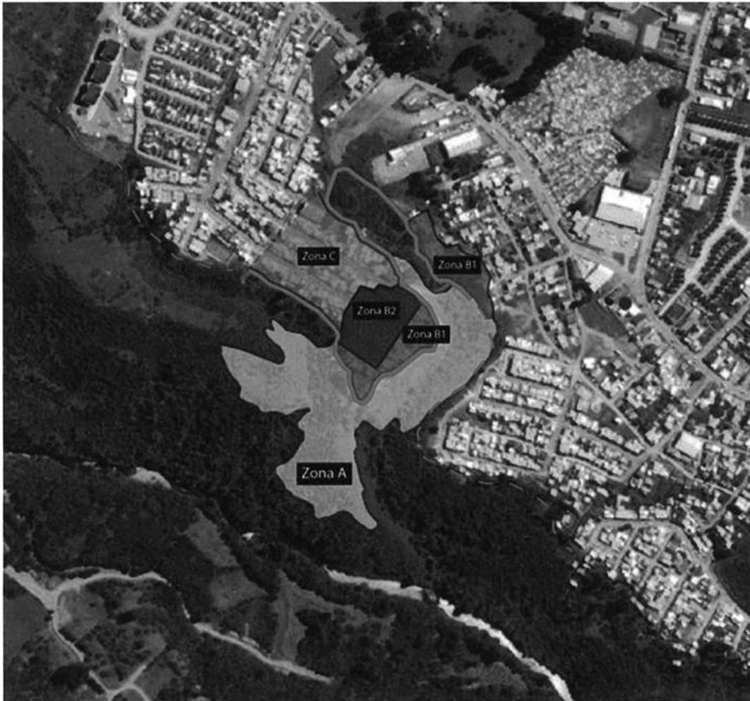
FIGURA 3: Esquema resumen zonificación

Del mismo modo a los casos mencionados anteriormente, la reconstrucción de unidades habitacionales en este sector debe considerar el análisis previo de las condiciones estructurales y mecánicas del terreno fundacional de las nuevas viviendas, junto al cálculo y estudio de la tipología de fundaciones asociadas a estas.