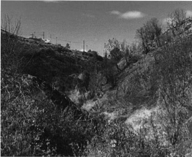
FIGURA 1: Vista actual Zona A, 12/01/2022